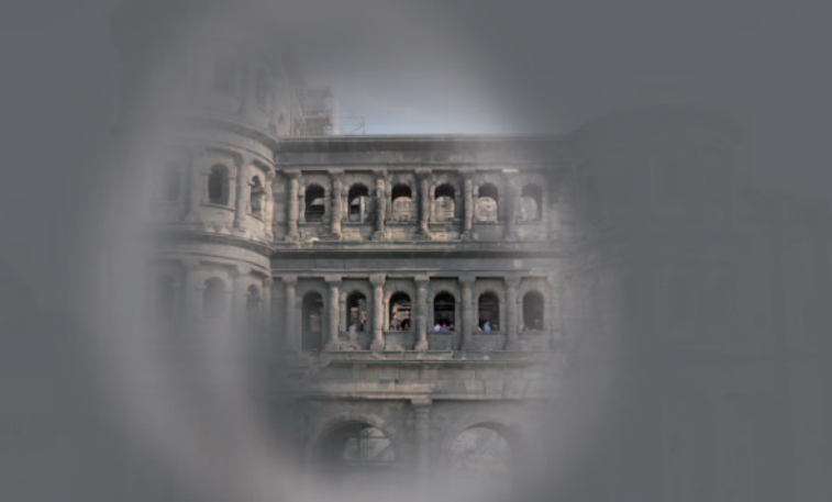
Seheinschränkung bei AMD