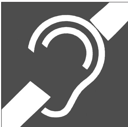
Abbildung 2: Piktogramm Schwerhörige / Gehörlose